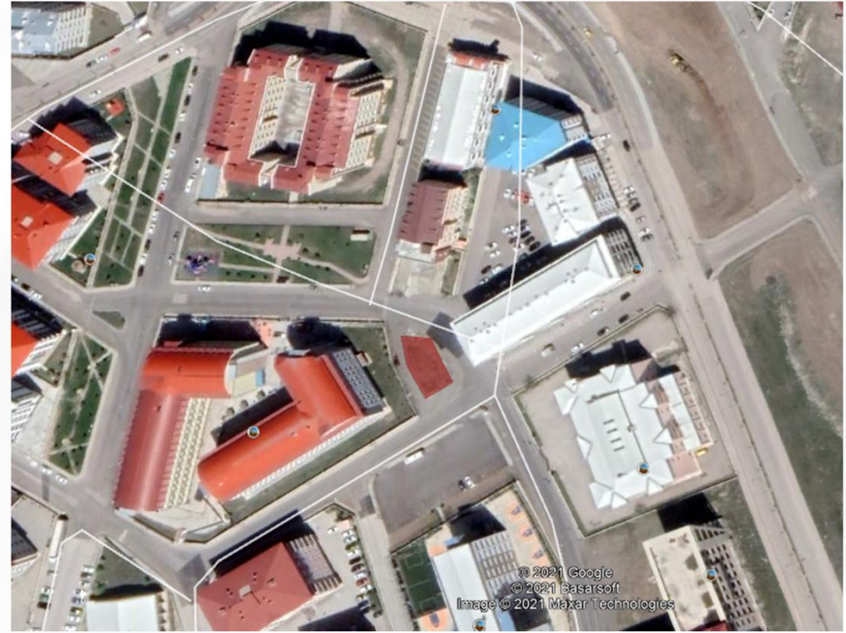
TKGM Parsel Görüntüsü