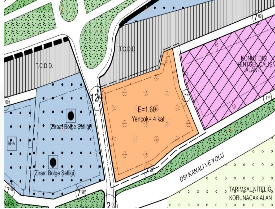
İmar Plan Değişiklik Sonrası Durum