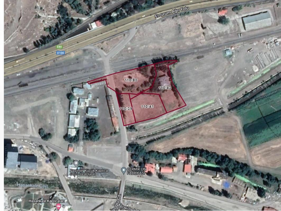
Alanın Yakın Uydu Görüntüsü