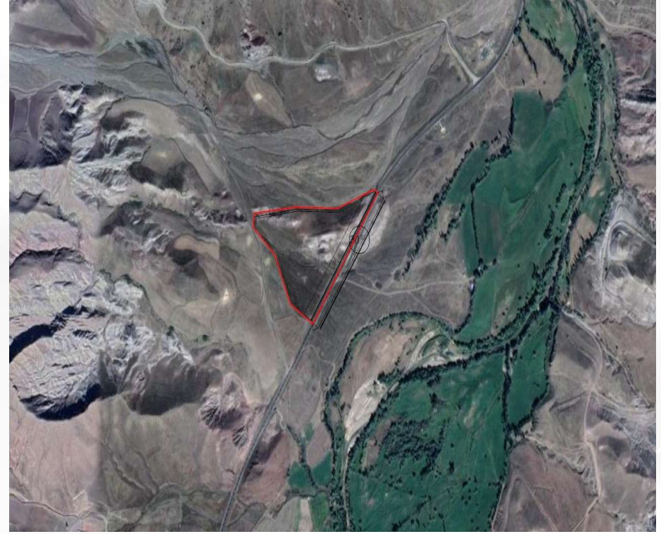
Alanın Yakın Uydu Görüntüsü