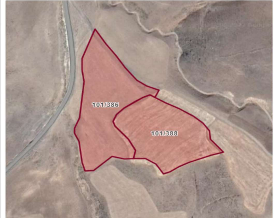
Alanın Yakın Uydu Görüntüsü