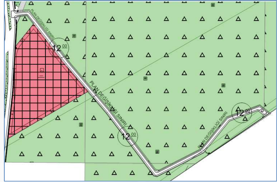
İmar Plan Değişiklik Sonrası Durum 1/1000 Uygulama İmar Planı