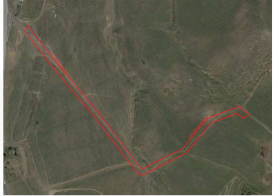
Alanın Uydu Görüntüsü (Yakın)