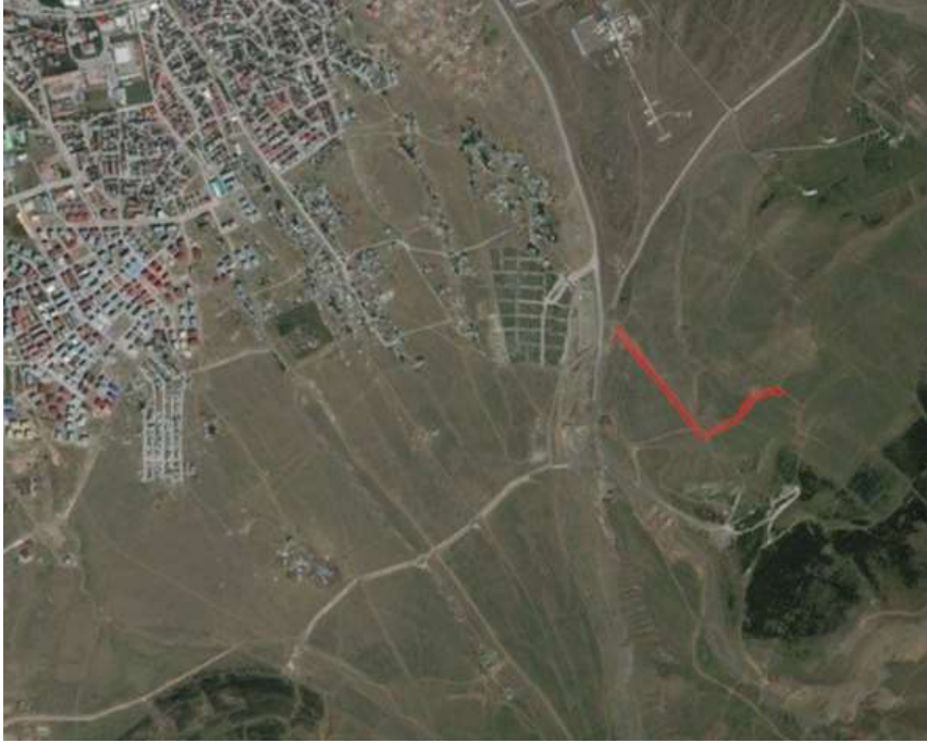
Alanın Uydu Görüntüsü (Uzak)