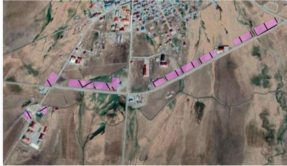
Alanın Uydu Görüntüsü (Yakın)