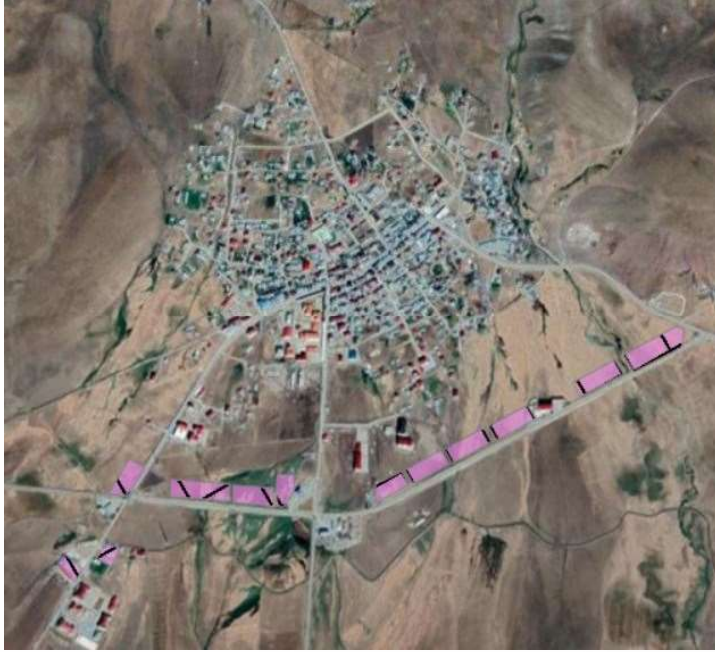
Alanın Uydu Görüntüsü (Uzak)