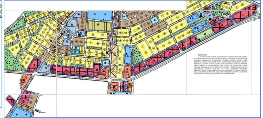
İmar Plan Değişiklik Öncesi Durum 1/1000 Uygulama İmar Planı