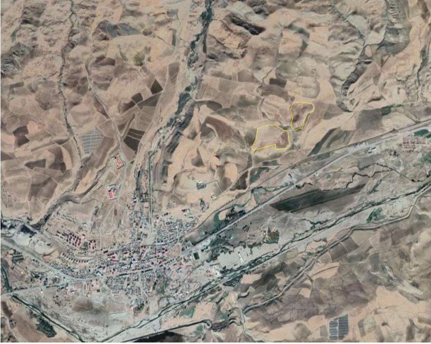
Alanın Uydu Görüntüsü (Uzak)