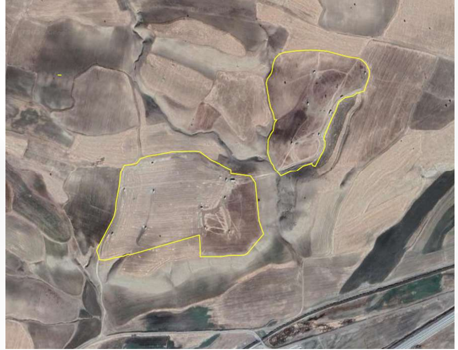
Alanın Uydu Görüntüsü (Yakın)