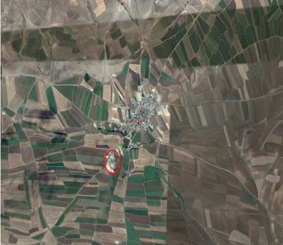
Alanın Uydu Görüntüsü

Pasinler İlçesi, Alvar Mahallesi, 0 ada 2018 nolu parselde kayıtlı taşınmaz meri imar planlarında A-2 Gelişme Konut Alanı olarak görülmekte olup söz konusu alanın Emsal= 1.00 Yençok 9.50 Tarım ve Hayvancılık Tesis Alanı olarak işlenmesini