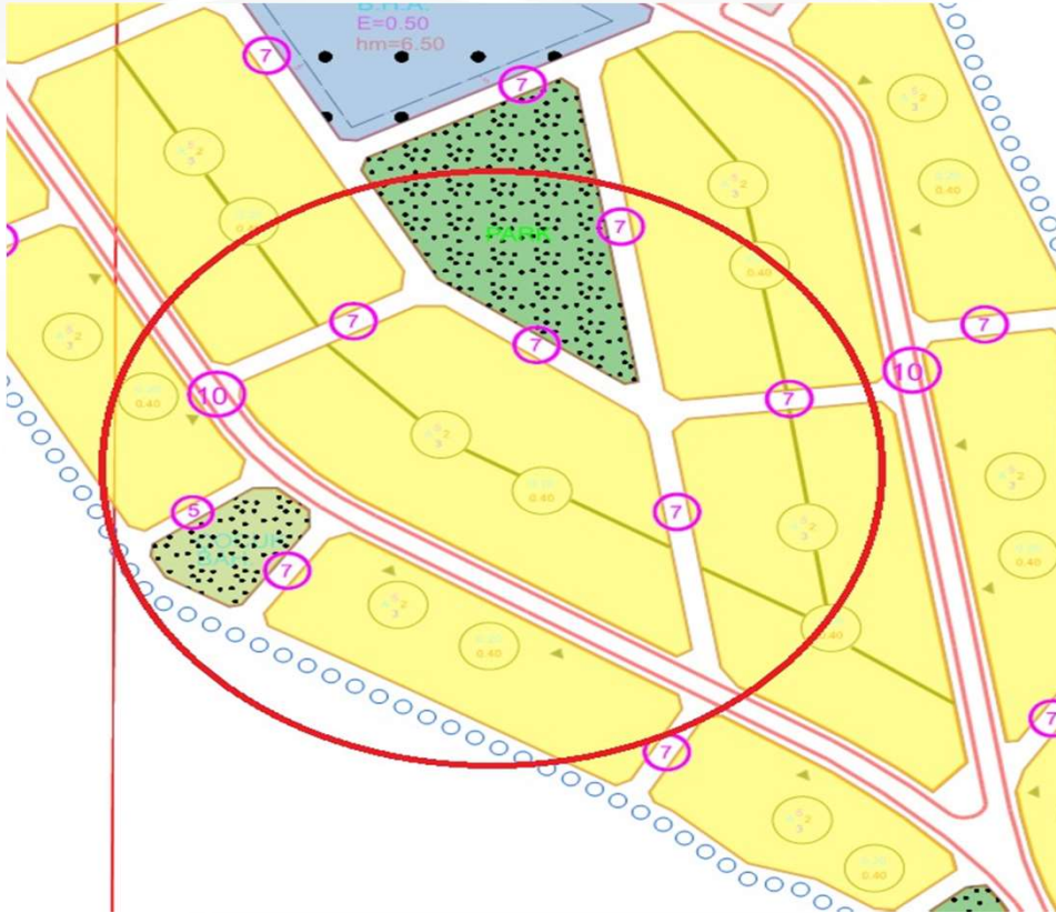
İmar Plan Değişiklik Öncesi Durum