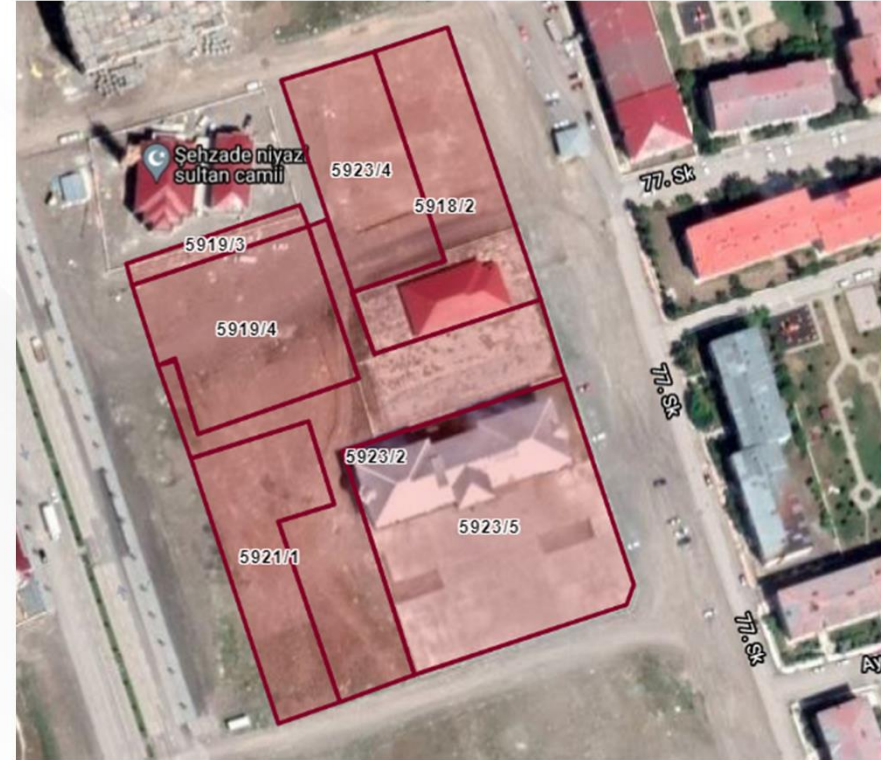
Alanın TKGM Parsel Uydu Görüntüsü