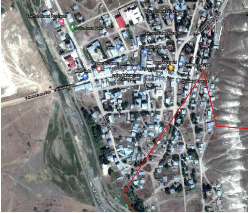
Alanın Uydu Görüntüsü

Tekman İlçesi, Aydınlık Mahallesi 169 ada 2 ve 5 numaralı parseller, Cihan Mahallesi 19 ve 21 numaralı parseller ve Vatan Mahallesi 234 ada 5 ve 6 numaralı parseller Ayırık Nizam 3 Kat yapılaşma koşulu ile yerleşik konut alanı, park alanı ve dere alanı bulunmakta olup mevcut imar planında 12 metrelik yola bağlanan 7 metrelik yolun 15 metreye çıkarılması