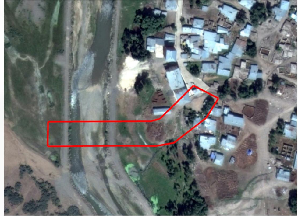
Alanın Yakın Uydu Görüntüsü