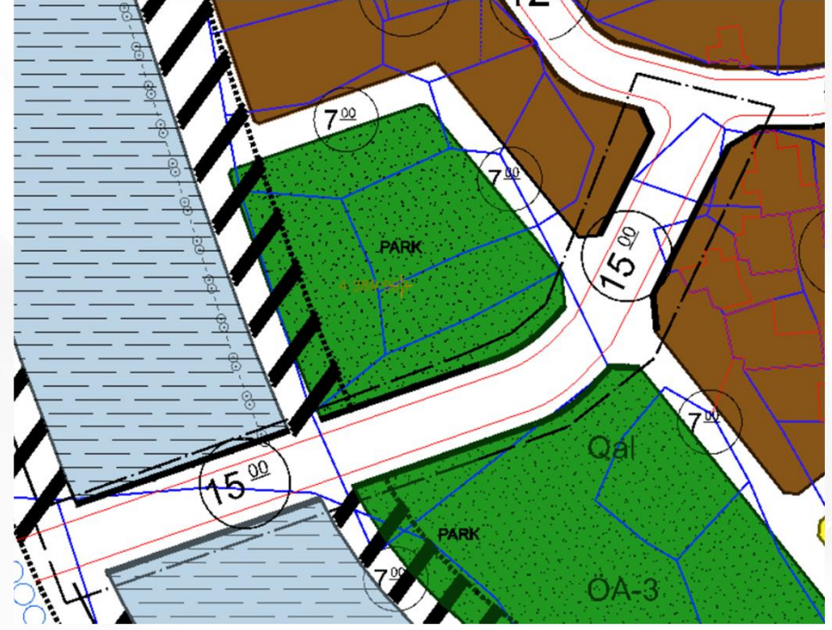
İmar Plan Değişiklik Sonrası Durum