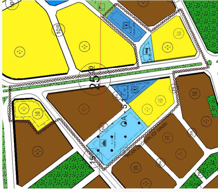
İmar Plan Değişiklik Sonrası Durum