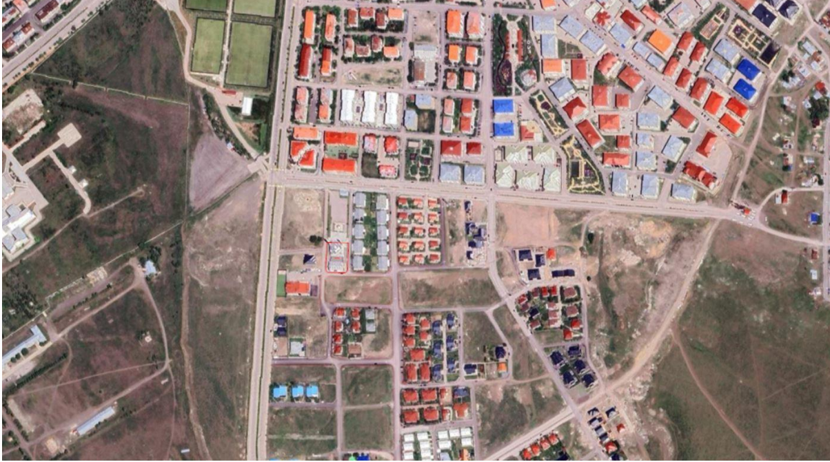
Alanın uzak Uydu Görüntüsü

Erzurum İli Palandöken İlçesi, Osman Bektaş Mahallesi, 9534 ada, 1 nolu parselin kuzeyinde yer alan taşınmazın bir kısmının, 1/5000 ölçekli Nazım İmar Planlarına Sosyal Tesis Alanı ve Trafo Alanı olarak işlenmesini içeren imar planı değişikliğinin görüşülmesi.