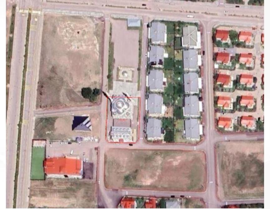
Alanın Yakın Uydu Görüntüsü