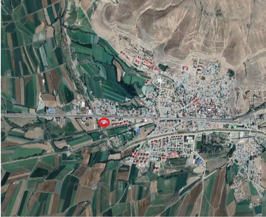
Alanın Uydu Görüntüsü (Uzak)