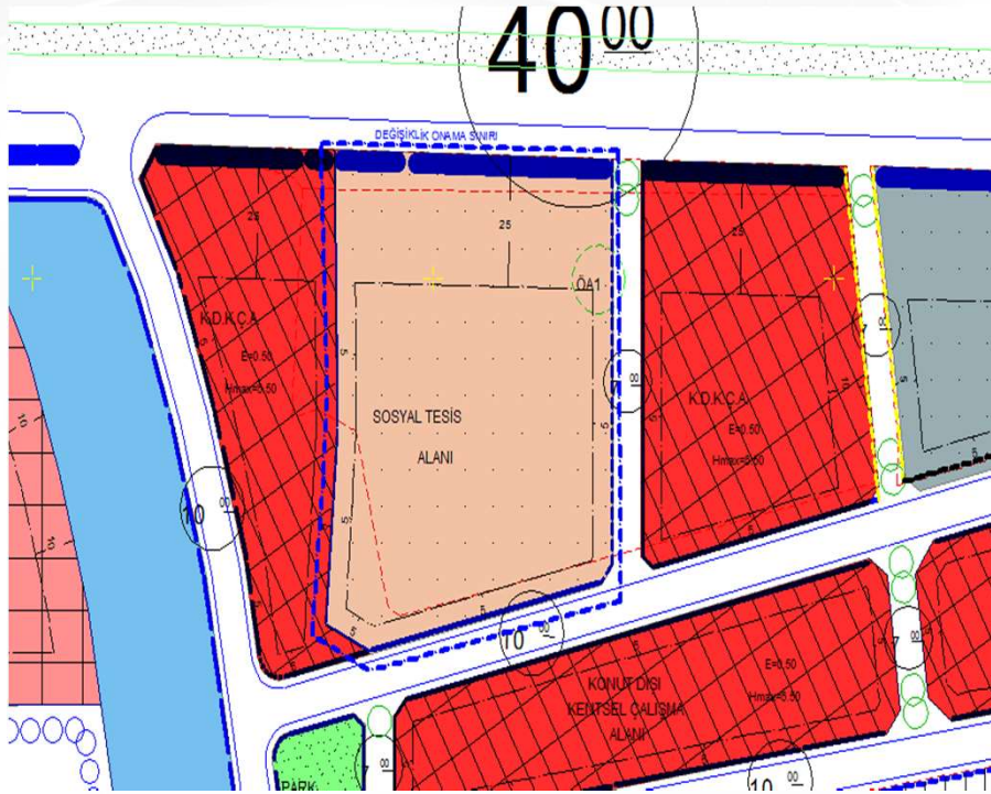
İmar Plan Değişiklik Öncesi Durum 1/1000 Uygulama İmar Planı