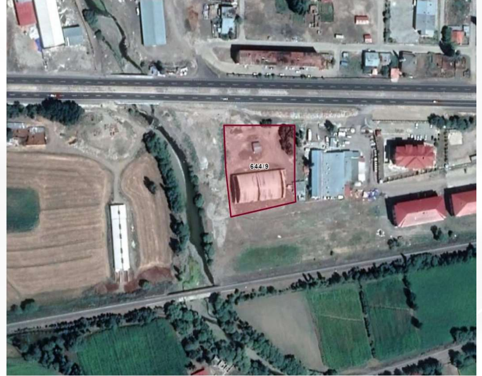
Alanın Uydu Görüntüsü (Yakın)