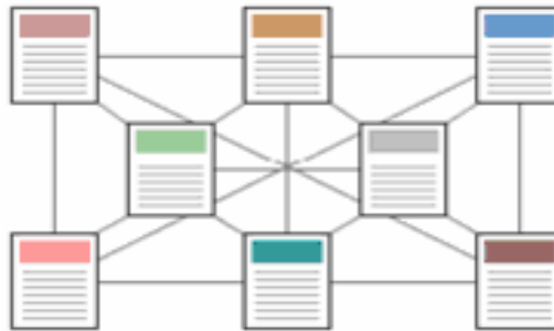
Şekil 5 Ağ Yapısı

Bu yapı getirdiği erişim kolaylığının yanında, karmaşıklığı artırmakta ve bakımı zorlaştırmaktadır.