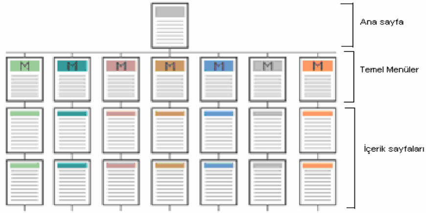
Şekil 1 Bilgi Yapılandırması

Site içinde sunulan bilgiler mantıksal anlamda tutarlı olacak şekilde organize edilmeli ve önem düzeyi de dikkate alınarak yapılandırılmalıdır. Şekil 1 'de örnek bir bilgi yapılandırılması verilmiştir. Bu yapı düzenli olup, her dokümanın kolay bulunabilmesini ve kolay geri dönüş imkanı sağlamaktadır.