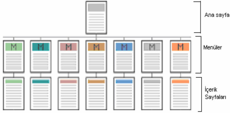
Şekil 6 Hiyerarşik Yapı

Aşağıdaki grafik bu dört tip yapılandırmanın çeşitli kriterler açısından karşılaştırmasını yapmaktadır. Grafikte yatay eksenle ilerledikçe anlaşılma zorluğu artmakta buna karşın esneklik kazanılmaktadır. Dikey eksenle ilerlemek ise karmaşıklığı artırmakta, kullanıcı bilgi düzeyinin artmasını gerektirmektedir.