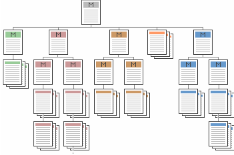
Şekil 10 Dengeli Menü Yapısı

Kamu kurumları internet sitelerinde site içi dolaşım sistemlerinin dengeli yapıda olmasına gayret gösterilmelidir. Kamu internet sitelerinde yer alan tüm sayfalar en az bir başka sayfaya bağlantı içermelidir. Her sayfa hiyerarşik yapıda bir üstünde olan sayfaya ya da ana sayfaya bağlanabilmelidir. Başka hiçbir sayfaya bağlantı içermeyen sayfalar “Çıkmaz Sokak” (Dead-End) olarak adlandırılır ve kullanıcı bu sayfalardan ancak tarayıcının sağladığı geri dönüş imkanıyla ayrılabilir. Kamu internet siteleri Çıkmaz Sokak içermemelidir.