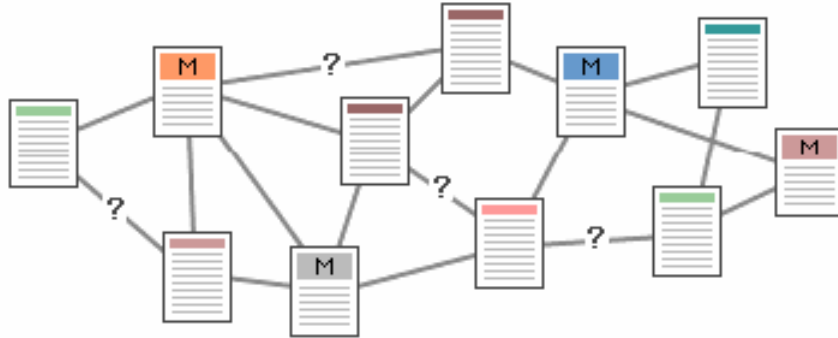
Şekil 2 Karmaşık yapı

Şekil 2 'de ise asla kurulmaması gereken bir bilgi organizasyonu gösterilmektedir. Bu örnekte, mantıksal bölümlenme yapılmamış, bağlantılar gelişigüzel verilmiştir. Sağlıklı dolaşım imkanı yoktur.