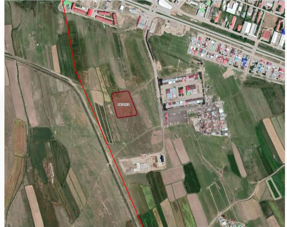
Alanın Uydu Görüntüsü (Yakın)