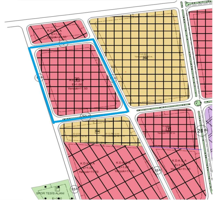
İmar Plan Değişiklik Sonrası Durum 1/1000 Uygulama İmar Planı