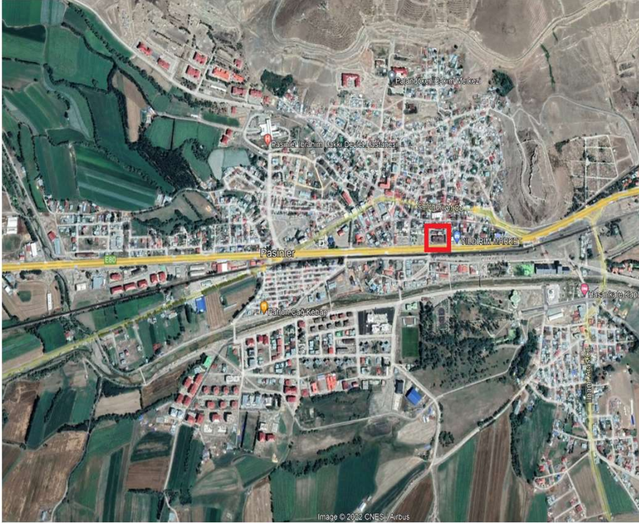
Alanın Uydu Görüntüsü