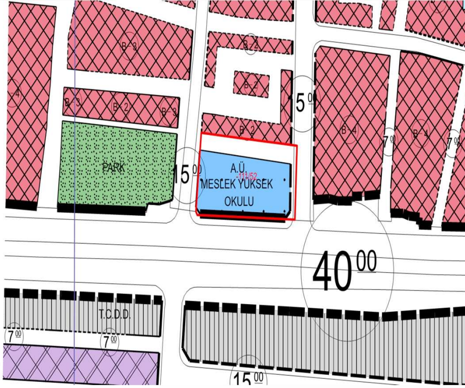
İmar Plan Değişiklik Öncesi Durum