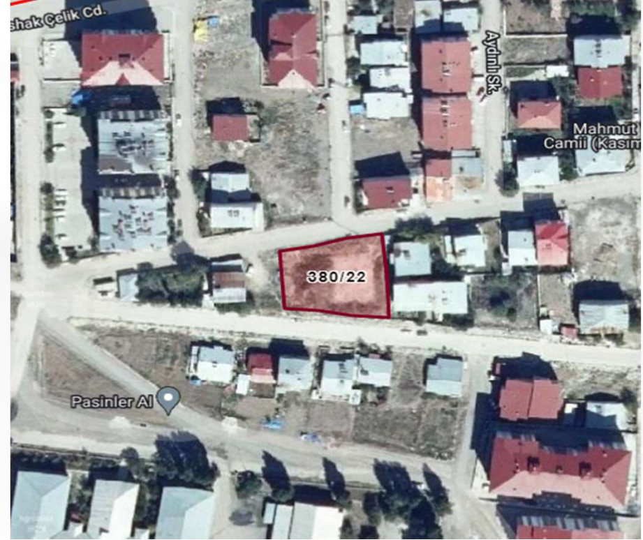
Alanın Uydu Görüntüsü (Yakın)