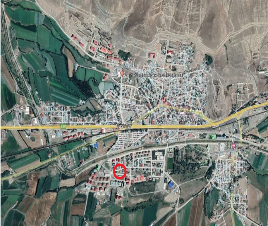
Alanın Uydu Görüntüsü (Uzak)